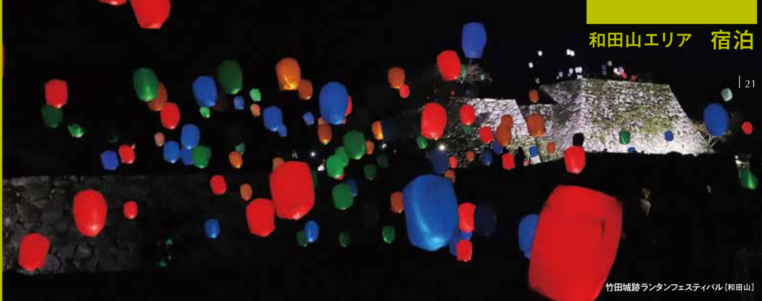
竹田城跡ランタンフェスティバル [和田山]